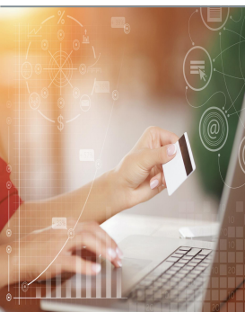
Tabela Geral – 480 €