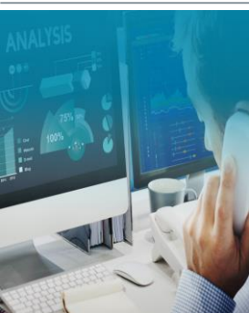
Tabela Geral: 533 €