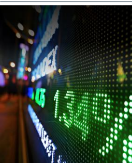
Tabela Geral: 573 €